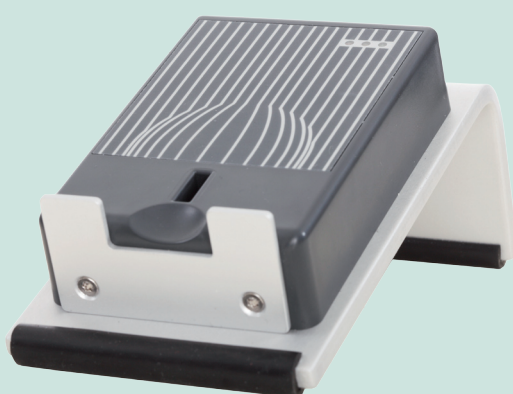
TL Gecko 272 USB

Ohne viel Platz zu beanspruchen nehmen die Tischleseeinheiten im Gesamtsystem eine zentrale Rolle ein.