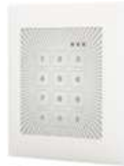
EDI advant PIN