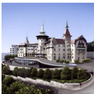
Hotel Dolder Waldhaus ****

Die Mitarbeiterinnen und Mitarbeiter des Hotel Dolder Waldhaus, der renommiertesten Adresse in Zürich, registrieren ihre Arbeitszeit und tätigen ihre Konsumationen mit ihrem persönlichen LEGIC® Ausweis