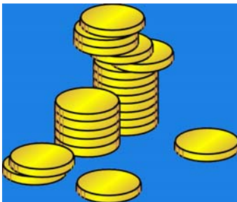
EVIS Preisliste 2005

Unsere Preisliste weist inzwischen 515 Artikel auf. Nach wie vor geben wir die Liste in zwei Varianten heraus. Die detaillierte Endverkaufspreisliste, in der alle Artikel genau beschrieben sind, sowie die Händlerlisten mit den Händlereinkaufskonditionen. Die neue Preisliste tritt ab dem 15. April 2005 in Kraft.