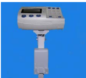
Pagecounter mit LEGIC

Messen, überwachen und verwalten von Dokumenten durch den Einsatz des persönlichen LEGIC Datenträgers. Pagecounter und Abrechnungssoftware ordnen und überwachen die anfallenden Kosten von Kopie, Druck und Fax.