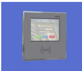
LEGIC Smart Touch Terminal

Für die Kodierung von LEGIC Datenträgern vor Ort gelangt neu das LEGIC Smart Touch Terminal zum Einsatz. Das kleine kompakte Terminal enthält die erforderliche Hardware, um LEGIC Datenträger mit Segmenten zu versehen. Ihr Einsatz? Das LEGIC Smart Touch Terminal eignet sich als Terminal für BDE, Zeitwirtschaft, Gebäudeleittechnik etc.