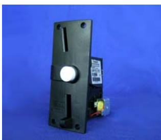
Münzprüfer IMP10 von PM

IMP10, der Münzprüfer mit direkter MDB-Schnittstelle. Die EVIS AG ist seit dem 15. Juli 2005 offizieller CH-Anbieter der Münzprüfsysteme der Phoenix Mecano Digital Elektronik GmbH (PM).