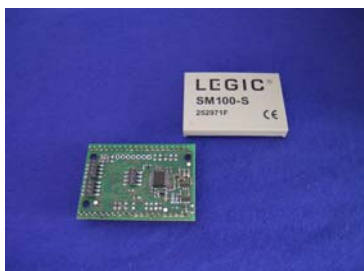
SM LEGIC advant