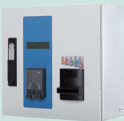
NL-EVITA Vega + Gecko272

Aufwertestation für bargeldlose Zahlungssysteme. Das Gerät lässt ohne Betreuungspersonal rund um die Uhr selbstständig Aufwertungen von Datenträgern vornehmen.