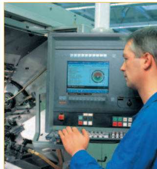
Benutzerbezogene Zugangs- und Funktionssteuerung zum Beispiel an Werkzeugmaschinen User-specific access and function control, e.g. on machine tools