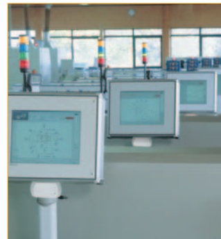
Personenidentifikation im Bereich von Industrie-PC's Personal identification in the industrial PC sector