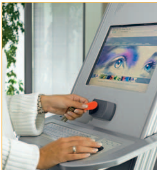
Gesteuerter Zugang zu Info-terminals Controlled access to info-terminals

The areas of application of the OEM-RFID module ADMITTO range from use as a classic read/write system for programming of transponder media to access control in PC systems, checkouts or info-terminals. Wherever admission authorization is requested or users have to be identified, ADMITTO can be comfortably integrated in table or mounted design, optionally with RS232 or USB interface.